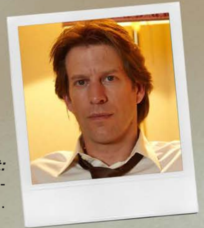
Benny - Andrew Tarbet: "Exodus: Dioses y Reyes", "Wal- king Tall", "Tengo ganas de ti"...