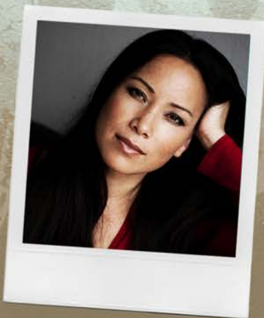
Lin - Nikol Kollars: "La Fuga", "Sing for Darfur", "Hidden Camera", "El asesino del parking"...